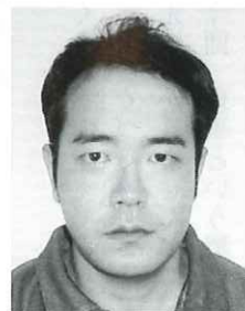
1974年4月23日生 血液型 AB型