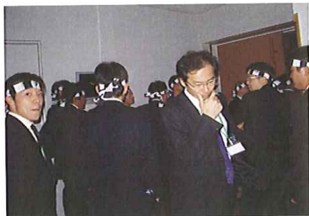
舞台袖にて(近畿支部のみなさん)

挨拶を行なっておりました。第十二回木材活用コンクール、第三十三回全国児童・生徒木工工作コンクールの表彰、会長の引継ぎと式は順調に進み、来年度の大会開催地発表を前に我々近畿支部の会員は全員鉢巻を巻き、会場袖へと控え、壇上には上がると手を振り上げて大阪への積極的参加を呼びかけました。