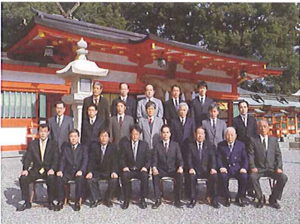
速玉大社にて集合写真

(速玉大社—牛ノ鼻神社—中村神社—鳥止野神社—阿須賀神社—神倉神社(遥拝)—王子神社(遥拝))