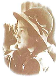
少女時代の美智子様

※民間出身の皇后様はこの半世紀喜びも、悲しみも、はかりしれない程の御苦労・御努力がおありになったと想います。そして多様なご経験からリベラルアーツ(幅広い教養)を身につけられた世界に誇りうる最高のファーストレディだと思います。