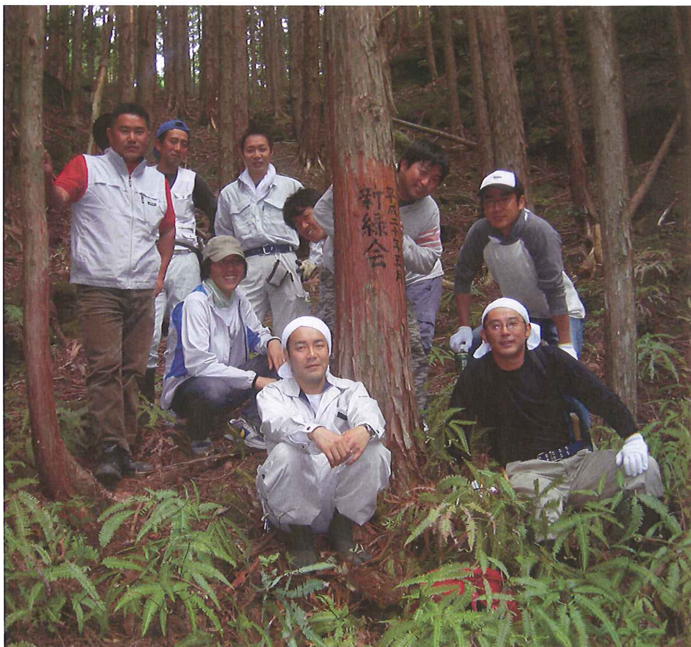
新緑会所有山林にて撮影

URL: http://www.shingumokkyo.com e-mail: s-mokkyo@shingumokkyo.com