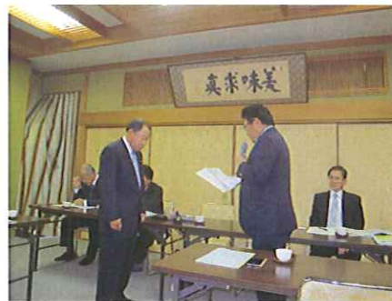
理事長よりお祝いのことば