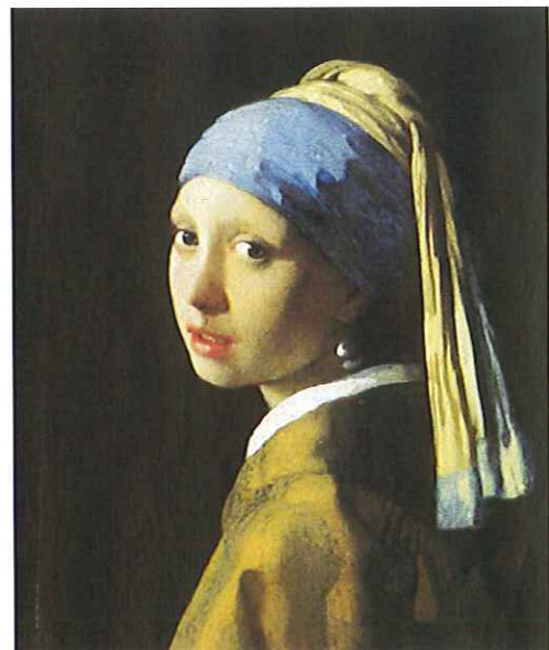
真珠の耳飾りの少女