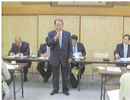
川崎氏よりお礼の挨拶