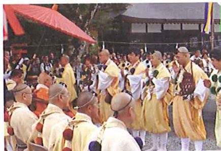
蔵王堂前庭にて大峯秘法採灯大護摩

告(なの)って「腹を切らんとする時の手本にせよ」と言い放ち、腹を一文字に掻切(かきき)り腸をつかんで床板に投げつけ、太刀を口にくわえてうつつ伏す、と『太平記』にかかっている。