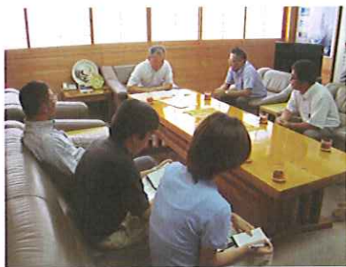
市長室にて(新宮市)

八月九日(木)、新宮市及び那智勝浦町―太地町を訪問し公共建築物には紀州材の利用をお願いしたいと要望活動を行なうと共に特に新宮市では、 一・熊野材使用住宅建築等への補助制度の復活 二・新宮市庁舎建築には熊野材の使用 三・南紀園建築には新宮・東牟婁地域材の使用 四・公共建築物へのアカネ材の利用促進 以上四点について要望致しました。