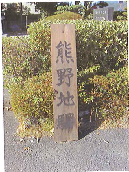
実際に使われていた木製看板