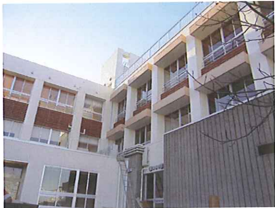
完成間近の新校舎外観

蓬萊小学校と王子小学校が統合され新しく『王子ヶ浜小学校』が今春に開校致しますが、内装にはふんだんに熊野材が使用されており新学期からは木の香り漂う教室での勉強が始まります。