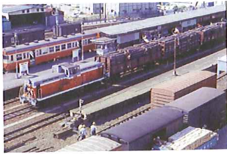
1977年 熊野地行貨物列車

新宮鐵道の新宮〜勝浦間が全線開通してから百周年を記念して三月二日(土) JR新宮駅にて記念式典が開催されることから、これに協賛し盛り上げるために開業当初に係わりが深かった新宮木材業界として次の通り協賛行事を開催する予定です。