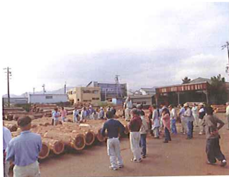
※ 上記写真はイメージです。