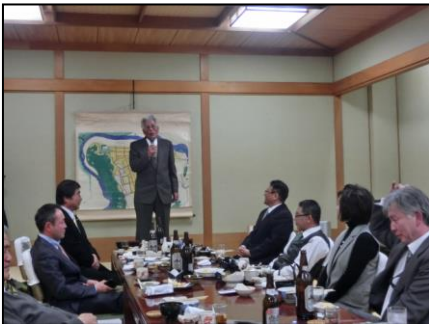
かわみでの懇親会

神倉神社と王子神社は速玉大社の せつしや 摂社（本社と末社の間に位置する神社）である阿須賀神社より遥拝