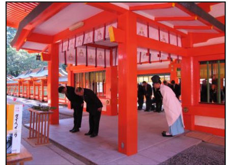
熊野速玉大社にて