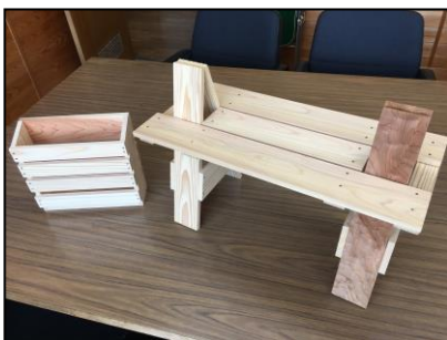
ティッシュケース (左) とミニベンチ (右)