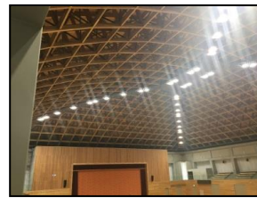
五條の「シダーアリーナ」

学校の校舎、中学校の体育館、ドームなどを木造で建築。デザインの良さなどが奏功し、人口が増えてきているという。