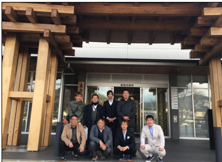
真庭市役所前にて集合写真