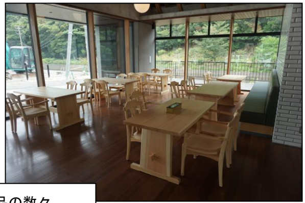
納入した備品の数々