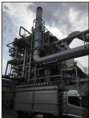
真庭バイオマス発電所