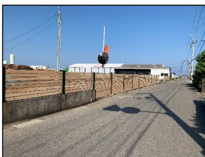
角材を利用した木柵

上貯木場と県道との境界に木皮等の飛散・流出防止のために木柵(木材フェンス)を設置しました。それにより出入口も1ヶ所となり管理面でも整備を図ることが出来ました。