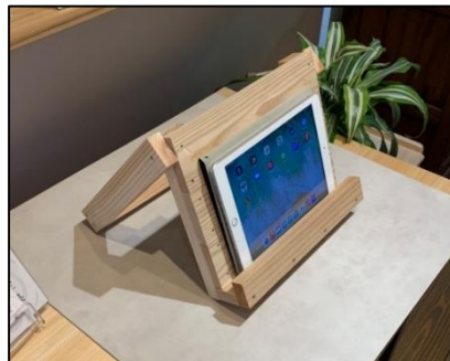
製作するキット(タブレット置台)

新緑会インスタグラムにも配信映像や当日の写真等をアップしておりますので気になる方はフォローの方よろしくお願致します。