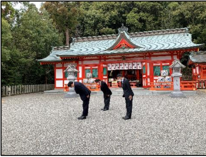
神倉神社への遥拝写真

神倉神社と王子神社は速玉大社の まっしや 摂社（本社と末社の間に位置する神社）である阿須賀神社より遥拝