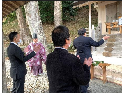
烏止野神社での玉串拝礼