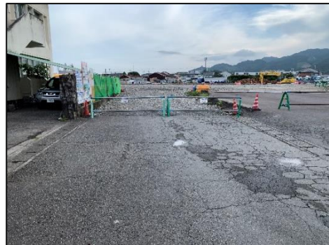
嵩上げされた会館横進入路