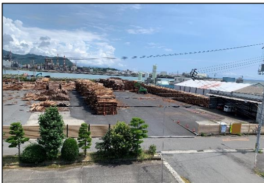
整備し新たに設けた出入口