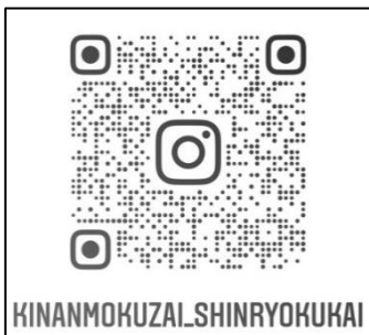
新緑会インスタアカウント

本番同様のリハーサル等様々なことを実施、検証し開催に踏み切りました。今回はインスタグラムのライブ配信を見て頂くことが前提となることからインスタグラムのメッセージ機能を利用した応募受付を7月5日(月)〜7月16日(金)で既に実施して済み、受付を終了しております。当初は参加希望者が少ないのではないかと不安でしたが、上限150キットに対して100名以上の応募を頂き心より感謝しております。 又、インスタを利用できないため参加できなかった方々には、心よりお詫び申し上げますと共にコロナが収束した際には例年通りの実施を予定しておりますのでご理解頂ければと思っております。 実施日は8月1日(日)です。次号に当日の様子等を掲載したいと思いますので、楽しみにして頂ければ幸いです。又、