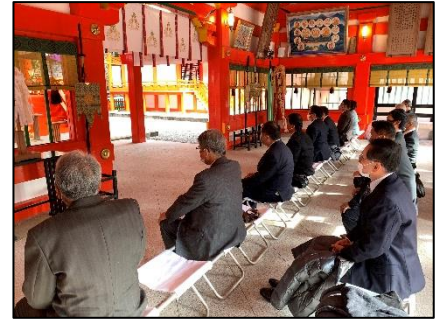
参加者全員で速玉大社参拝